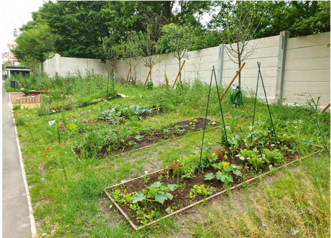
Abbildung 6 Pflanzbeete können von Anwohnenden genutzt werden und bieten durch die begleitende Grüneinrahmung auch noch Lebensraum für Tiere und Pflanzen.

Zu besichtigen ist die Biotope City Wienerberg im Rahmen der 2022 stattfindenden Internationalen Bauausstellung in Wien, Informationen finden sich auch im Netz :