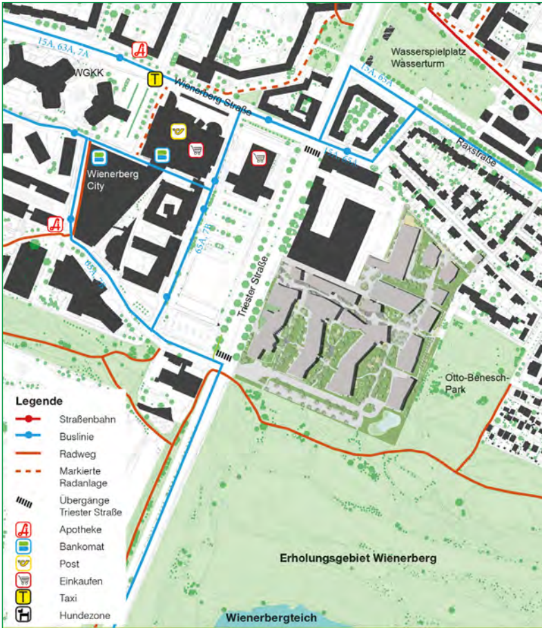
Abbildung 2 Lageplan:

Die Biotope City Wienerberg (hellgrau) grenzt im Süden an das Erholungsgebiet Wienerberg und ist durch von Süden nach Norden verlaufende Grünflächen in die Landschaft eingebunden.